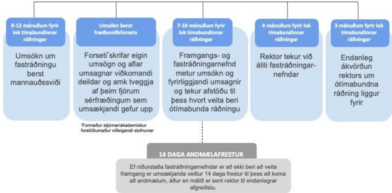
Mynd 1: Ferill umsóknar um ótímabunda ráðningu og mikilvægar tímasetningar