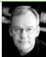
Dr. Hannes Hólmsteinn Gissurarson

Ph.D. í kynjafræði, aðjúnkt við Stjórn mála- fræðideild HÍ